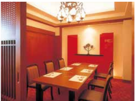
少人数でもご利用しやすいテーブル席