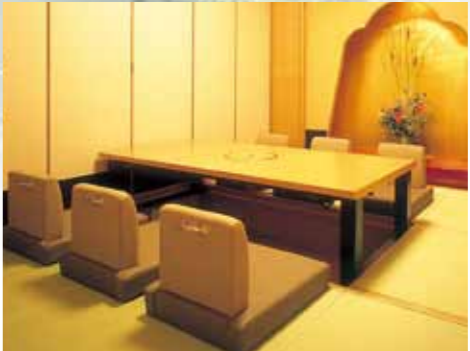
赤ちゃんも安心な畳の和室

はこだて亭では、お集まりの人数に合わせてご利用頂けますよう 大小様々なタイプのお部屋をご用意しております。 また、お子様からご年配の方、お身体の不自体な方まで 安心しておくつろぎ頂けます。