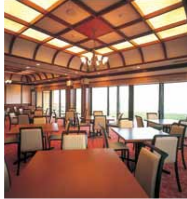
大人数でもご利用頂ける広々とした大広間 バリアフリーで車椅子でも安心です