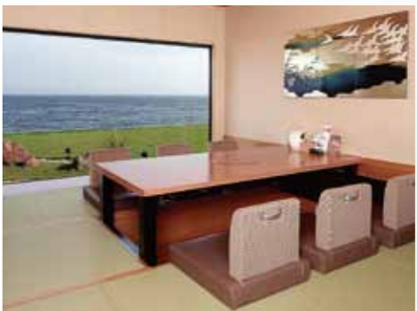
海の見える和室の個室席